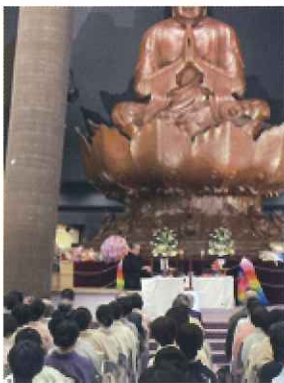
御家元猶有齋宗匠御献茶の様子

3月10日、表千家同門会沖縄県支部（湧川昌秀支部長の支部設立の60周年を記念して「御家元猶有齋宗匠御献茶」が沖縄平和祈念堂で開催され、茶道関係者約160人が参加した。参加者が見つめる厳かな雰囲気の中、表千家15代家元猶有齋千宗左宗匠が平和を祈念しお献茶を厳かに行い、平和祈念像に茶を献じた。平成25年には同県支部設立50周年記念の献茶式があり、その際には14代家元而妙齋宗匠が行った。