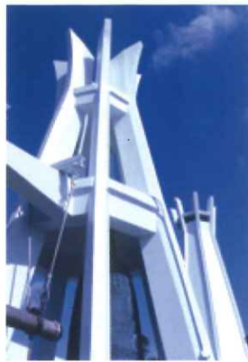
工事を終えた平和の鐘「鐘楼」

沖縄平和祈念堂開堂時に、平和祈念堂の理念に賛同したライオンズクラブ国際協会337複合地区から寄贈された平和の鐘を吊るす鐘楼も堂宇防水塗装工事と併せて工事を行った。