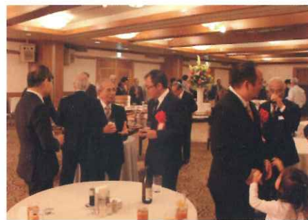
受賞者を囲んで歓談