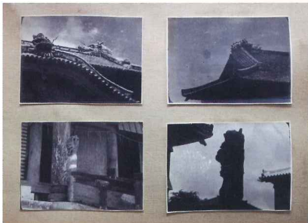
沖縄戦焼失前の首里城正殿龍頭棟飾と大龍柱